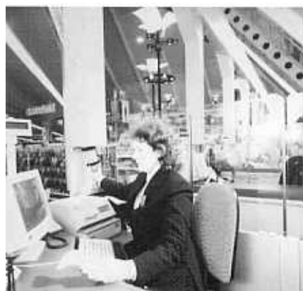
Bild 2 und 3: Nach dem bequemen Befüllen des Rohrpostbehälters mit Bargeld wird er zum Direkt-Transport zur Hauptkasse aufgegeben.