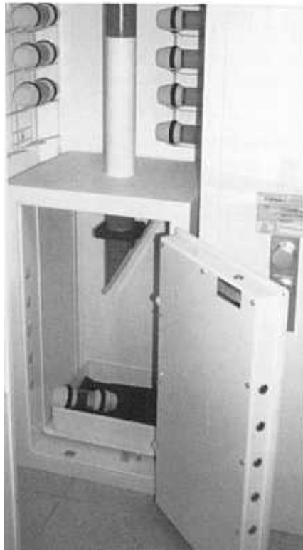
Bild 5: Der hauseigene Tresor ist direkt an die Hauptkasse angeschlossen und hält das Bargeld jederzeit unter Verschluss.

falls mit einem Rohrpostsystem ausgestattet, um Folgefällen vorzubeugen, denn die Systeme sind auch als Präventivmaßnahme sehr gut geeignet. Dem „kriminellen Auge“ wird visualisiert, dass an den Kassen nichts zu holen ist; eventuelle Tatabsichten werden nachweislich gesenkt oder sogar vollständig aufgegeben. Der Vorzug des in sich geschlossenen Transportsystems für Bargeld und die