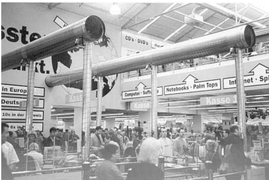
Bild 1: Kassen-Rohrpostsystem in Wickelfalzhöhren im Media-Markt, Hannover

Durch die zum 31.12.2001 begonnene Währungsumstellung auf den Euro und die Möglichkeit, bis zum 28. Februar 2002 im deutschen Einzelhandel nach wie vor in DM zu bezahlen, erhöhten sich die Bargeldbestände an den Kassen auf das Acht- bis Zehnfache – eine große Verlockung für kriminelle Potenziale. Doch nicht nur in Sondersituationen wie dieser befinden sich in den Kassen des Einzelhandels oder auch von Tankstellen häufig enorme Summen Bargelds, dessen risikolose Entsorgung nicht zu jeder Zeit gewährleistet ist. Wohin also mit den Einnahmen? „Ab, in die Röhre!“ könnte die Antwort lauten.